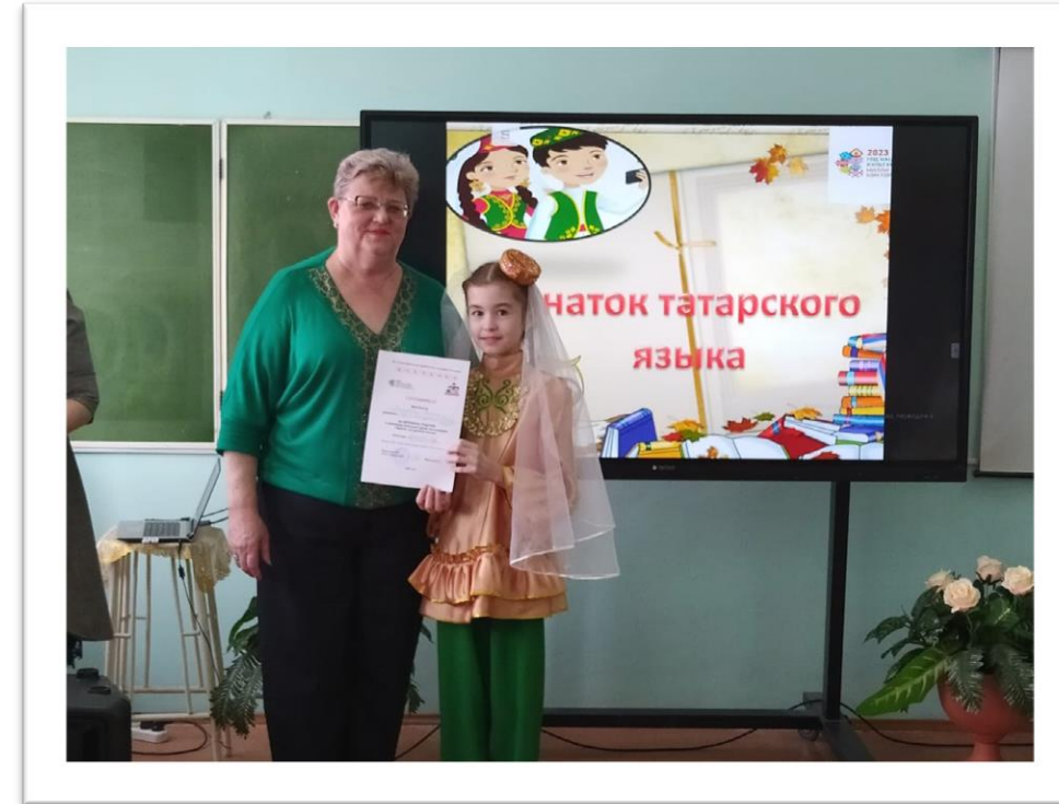
I место в муниципальном конкурсе «Знаток татарского языка среди русскоязычных детей» с.Верхний Услон