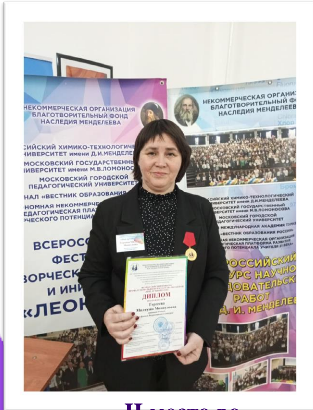
II место во Всероссийском конкурсе «Мой лучший урок» г. Москва